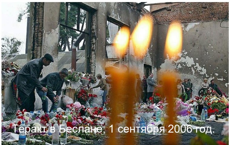
Теракт в Беслане, 1 сентября 2006 год.

ПРОТИВОДЕЙСТВИЕ ТЕРРОРИЗМУ — это деятельность органов государственной власти и органов местного самоуправления, а также физических и юридических лиц по: